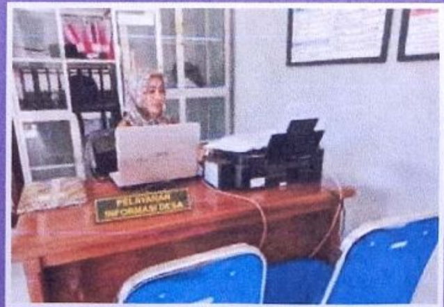
Foto Desk Layanan Informasi Publik

Disamping penyediaan ruang dan meja layanan informasi, untuk mengakomodir kepentingan publik dalam mengakses layanan permohonan informasi, Pemerintah Desa Kedungsumber juga menyediakan akses layanan permohonan informasi PPID melalui e-mail dседungsumber@gmail.com dan formulir online yang tersedia di website https://kedungsumber.desa.id/ . Pemohon Informasi dapat dengan mudah mengakses layanan permohonan informasi secara online melalui website tersebut, kemudian permohonan informasi yang diterima secara online tersebut diproses melalui layanan back office oleh petugas layanan PPID. Selain akses tersebut, bagi masyarakat yang hendak menyampaikan pertanyaan umum berkaitan dengan tugas fungsi Pemerintah Desa Kedungsumber dapat juga melalui layanan telepon.